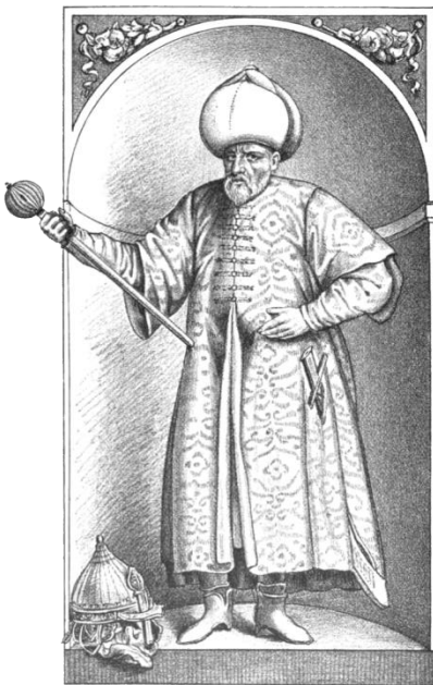
Мехмед паша Соколовић

Минијатура која приказује долазак хришћанске дјеце у Цариград, одабране девширмом.