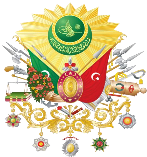
Амблем Османског царства

Османско царство било је једна од најмоћнијих држава у историји човјеченства. На врхунцу своје моћи царство се простирало на три континента и захварало је територију од Крима на сјеверу до Судана и Арабије на југу и од Беча на западу до Персијског залива на истоку. Овај територијални опсег држава је постигла за вријеме њеног најмоћнијег владара Сулејмана Величанственог.